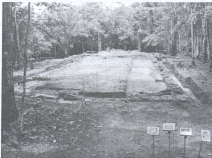
Figura 03: Panorâmica dos alicerces da igreja após esta etapa das escavações. Observa-se que os restos de parede agora fazem sentido, complementando a área do altar mor 23

À noite, os mouros deram um baile de máscaras para que os cristãos que quisessem mudar de lado o fizessem sem ser reconhecidos pelos seus superiores. Os cristãos compareceram à festa mascarados e distribuíram a comida envenenada para os mouros. Como resultado, até o rei Caldeira acabou morto. Esse e outros episódios da guerra entre cristãos e muçulmanos são lembrados todo ano na festa de São Tiago através de representações 22 .