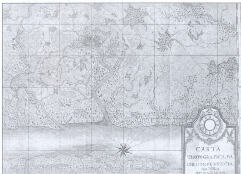
Figura 01: Carta topográfica da Vila de Mazagão - pertencente a Coleção Cartográfica do Arquivo Ultramarino de Lisboa 8